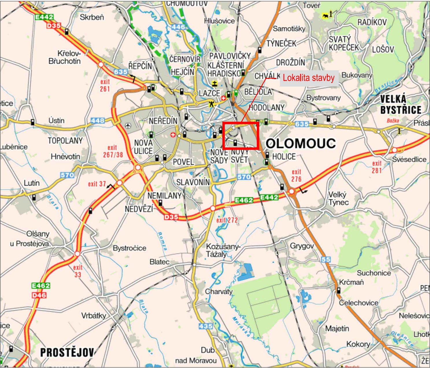
PŘEHLEDNÁ SITUACE, M 1:100 000